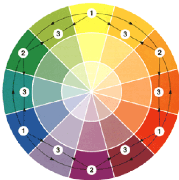
Рис.1 Цветовой круг Гёте

Рассмотрим широко используемый из них - круг естественных цветов по Гёте, состоящий из 12 секторов :